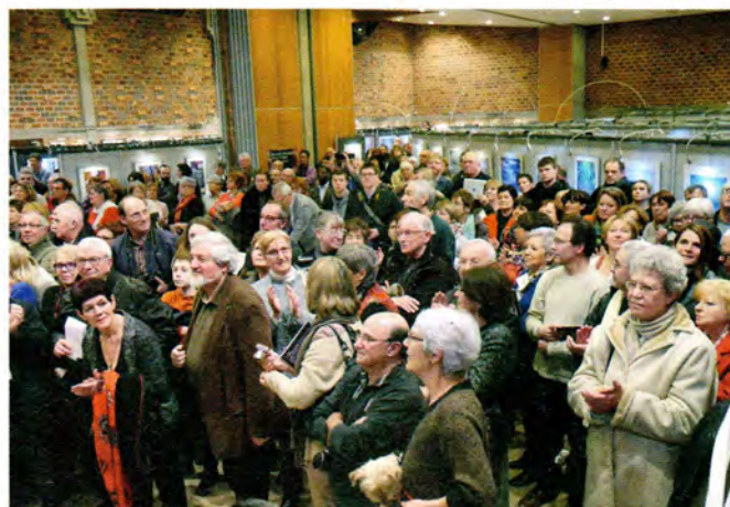
Le public est venu nombreux pour le vernissage !