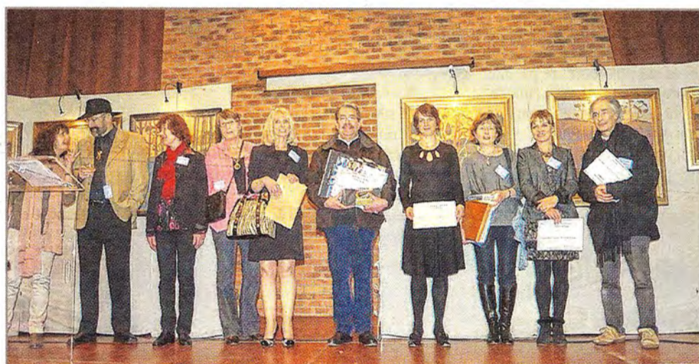
Des prix sont décernés aux artistes invités au cours du salon.