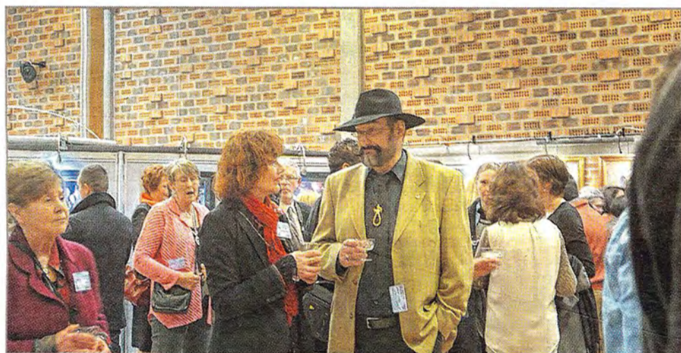
L'univers de Franck C. Hauser avait captivé le public lors de la précédente édition.