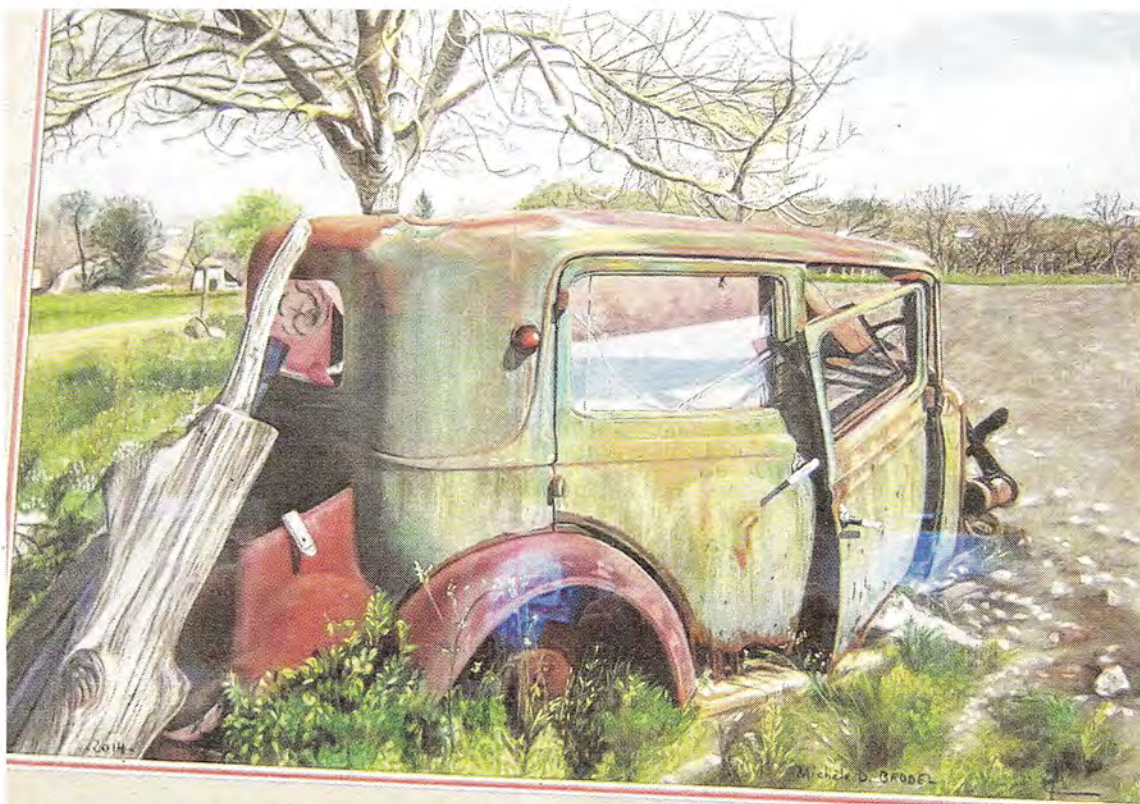
L'une des œuvres exposées à la Biennale Pastel d'Opale.

du pastel seront organisées. ■ Site de l'exposition : www.salon.pasteldopale.fr Tel : 09 64 25 03 61 et 06 85 32 38 24